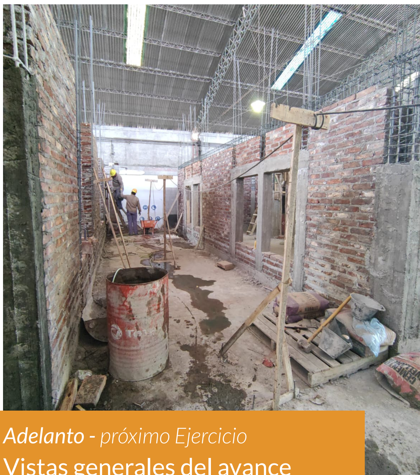
Adelanto - próximo Ejercicio Vistas generales del avance