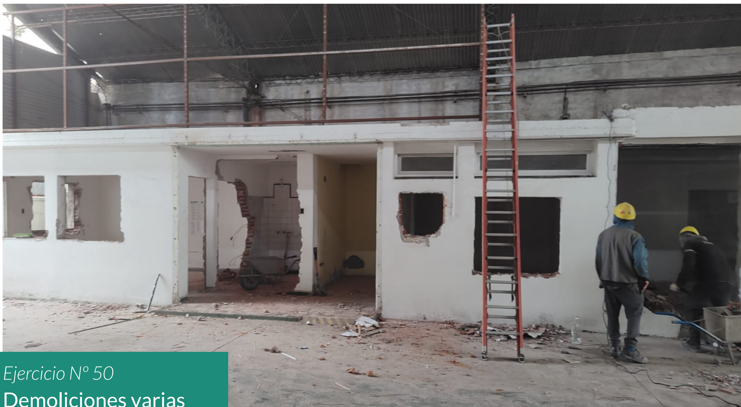
Ejercicio N° 50 Demoliciones varias