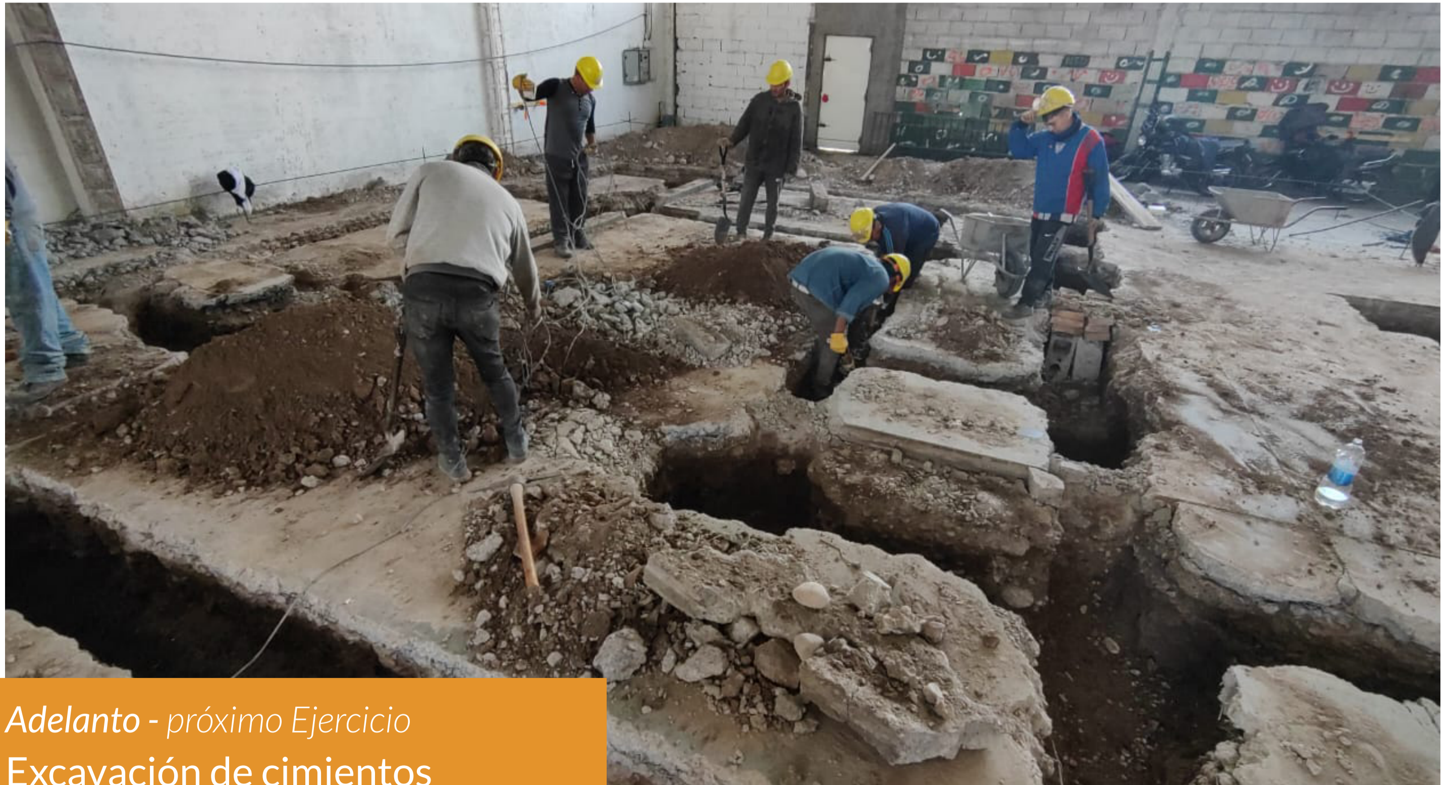
Adelanto - próximo Ejercicio Excavación de cimientos