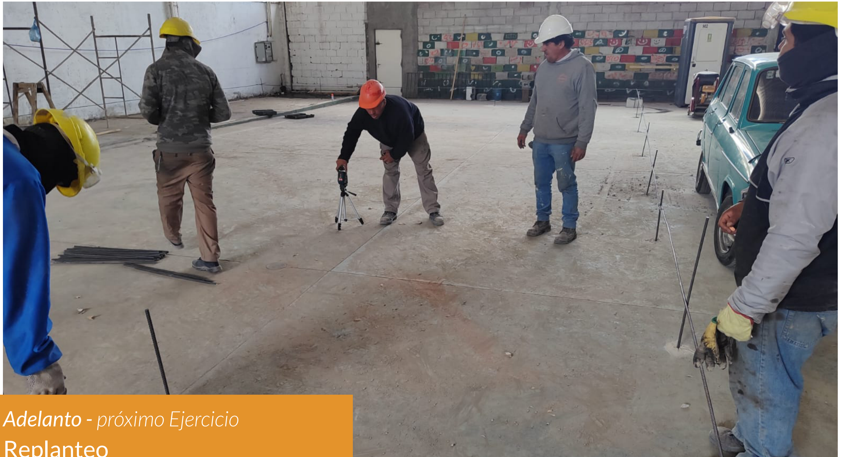
Adelanto - próximo Ejercicio Replanteo