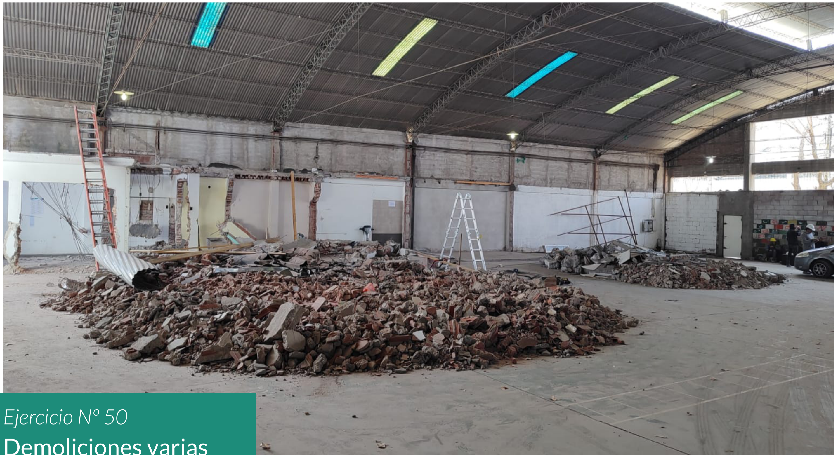
Ejercicio N° 50 Demoliciones varias